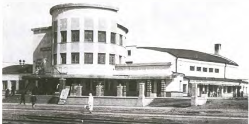
«Коммунар» после реконструкции 1934 г. Фото 1935 г.