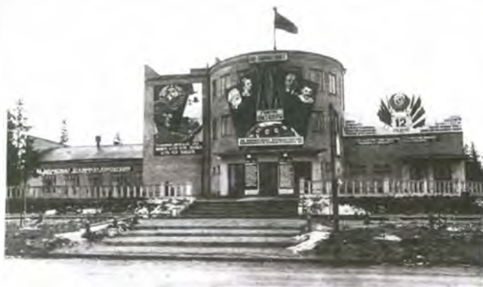
Кинотеатр «Авангард» в Березниках. 1937 г.

Интересно и само местоположение «Коммунара». Ныне его размещение в центре города на одной из главных магистралей — проспекте Металлургов — выглядит вполне логичным и даже оптимальным. Но так стало далеко не сразу. В 1931 г. ещё отсутствовал генеральный план города, возведение основного массива капитальной застройки — так называемого Соцгорода — велось вне каких-либо проектов планировки. И хотя в этом же 1931 году строительство Соцгорода активно началось по только что составленному проекту группы немецких архитекторов во главе с Э. Маем, но местоположение звукового кинотеатра этот план не затронул — в итоге