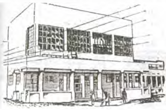
Звуковое кино. Первое в Прокопьевске. «Советская Сибирь». 1 ноября 1933 г. Открыто 6 ноября 1933 г.