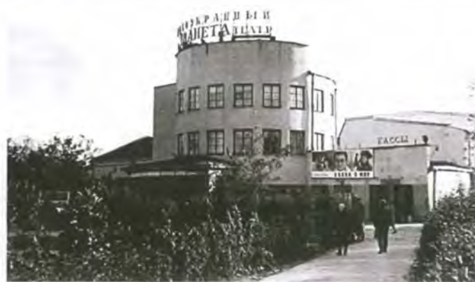
Кинотеатр «Победа» («Планета») в Люберцах. 1960-е гг.