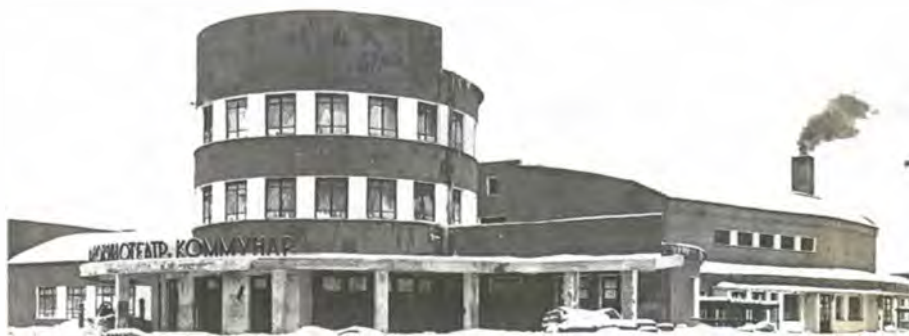
Кинотеатр «Коммунар». Зима 1933 г.

Звуковое кино. Сталинск. Сдача в эксплуатацию. Газета «За социалистический город». 5 ноября 1933 г.